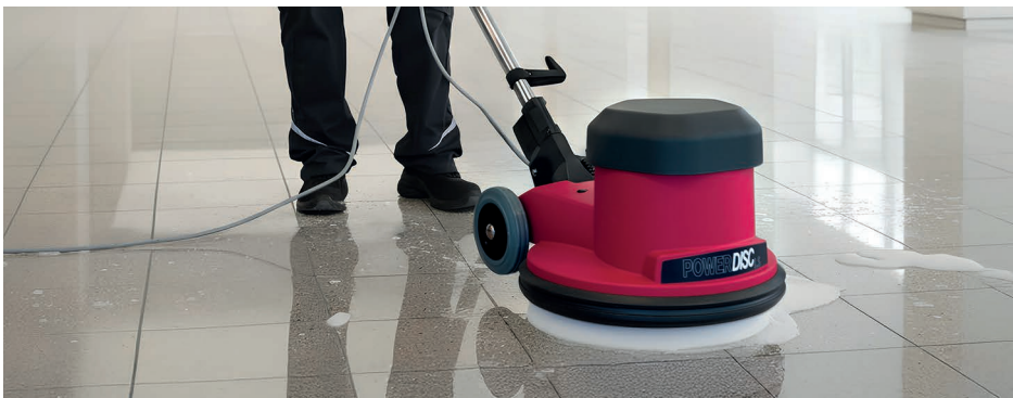
Zuverlässige Einscheibenmaschine für gründliche Reinigung in öffentlichen, gewerblichen und sensiblen Bereichen.