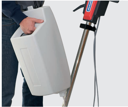
Einfache Montage und Demontage des Laugentanks (optional)